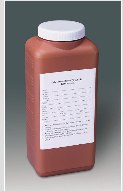
Urin-Sammelflasche (2000 ml und 2500 ml)

Die URIVETTE® ist eine skalierte Einmal-Urin-Entnahme mit Schraubstopfen und Saugschlauch. Die URIVETTE® BAK bietet zudem eine Stabilisierung der Keimzahl im Urin für ca. 24 h.