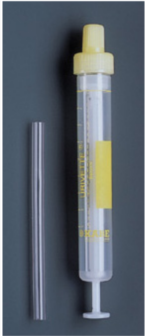
URIVETTE® (8 ml und 10 ml, steril und unsteril)