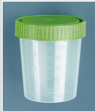
Urinsammelbecher mit Schraubverschluss (100 ml, steril und unsteril)